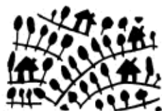
Le village et les cultures

Sur 300 m 2 , nous vous proposons de découvrir toutes les variations qu'offre chaque secteur sur 1600 mètres de dénivelé : les villages et les cultures, les forêts de feuillus et de résineux, les prairies et les crêtes.