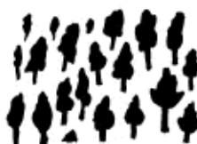
La forêt de feuillus