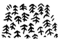
La forêt de résineux